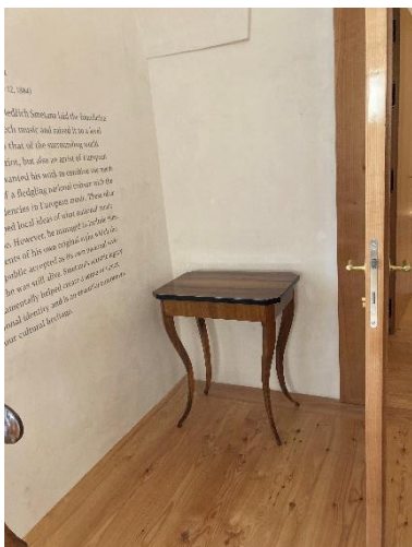
Stolek – 1 ks