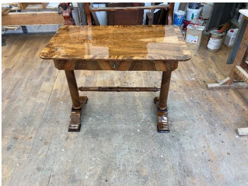
Stolek – 1 ks