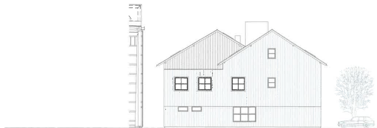
SEVERNÍ POHLED - STÁVAJÍCÍ STAV