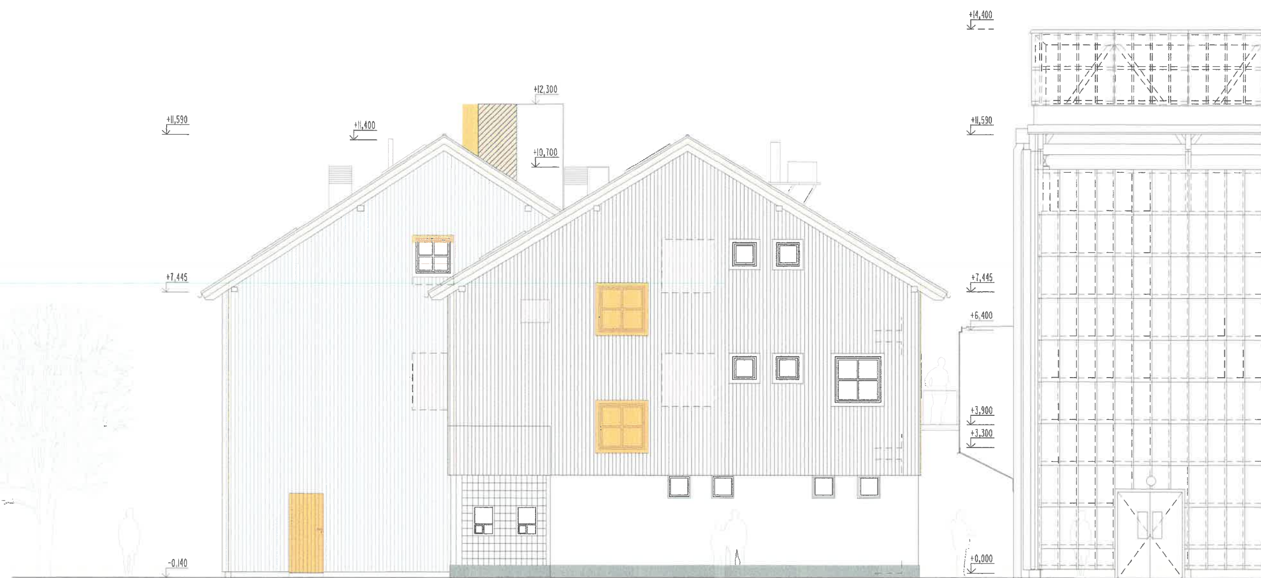
JIŽNÍ POHLED - NÁVRH