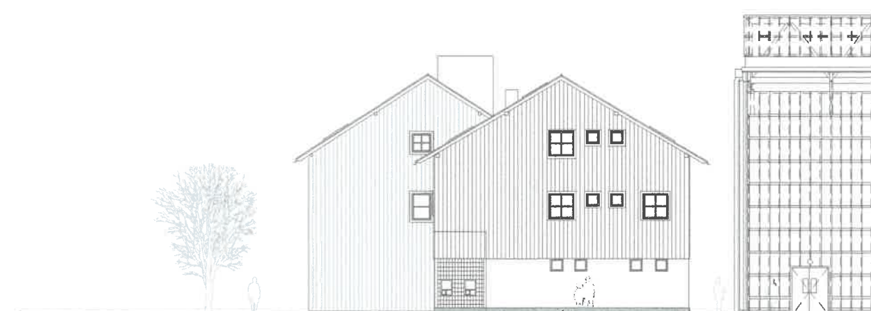
JIŽNÍ POHLED - STÁVAJÍCÍ STAV

POZNÁMKA : - VŠECHNA STÁVAJÍCÍ STŘEŠNÍ OKNA ZNOVU OSAZENA KVŮLI JINÉ SKLADBĚ STŘECHY