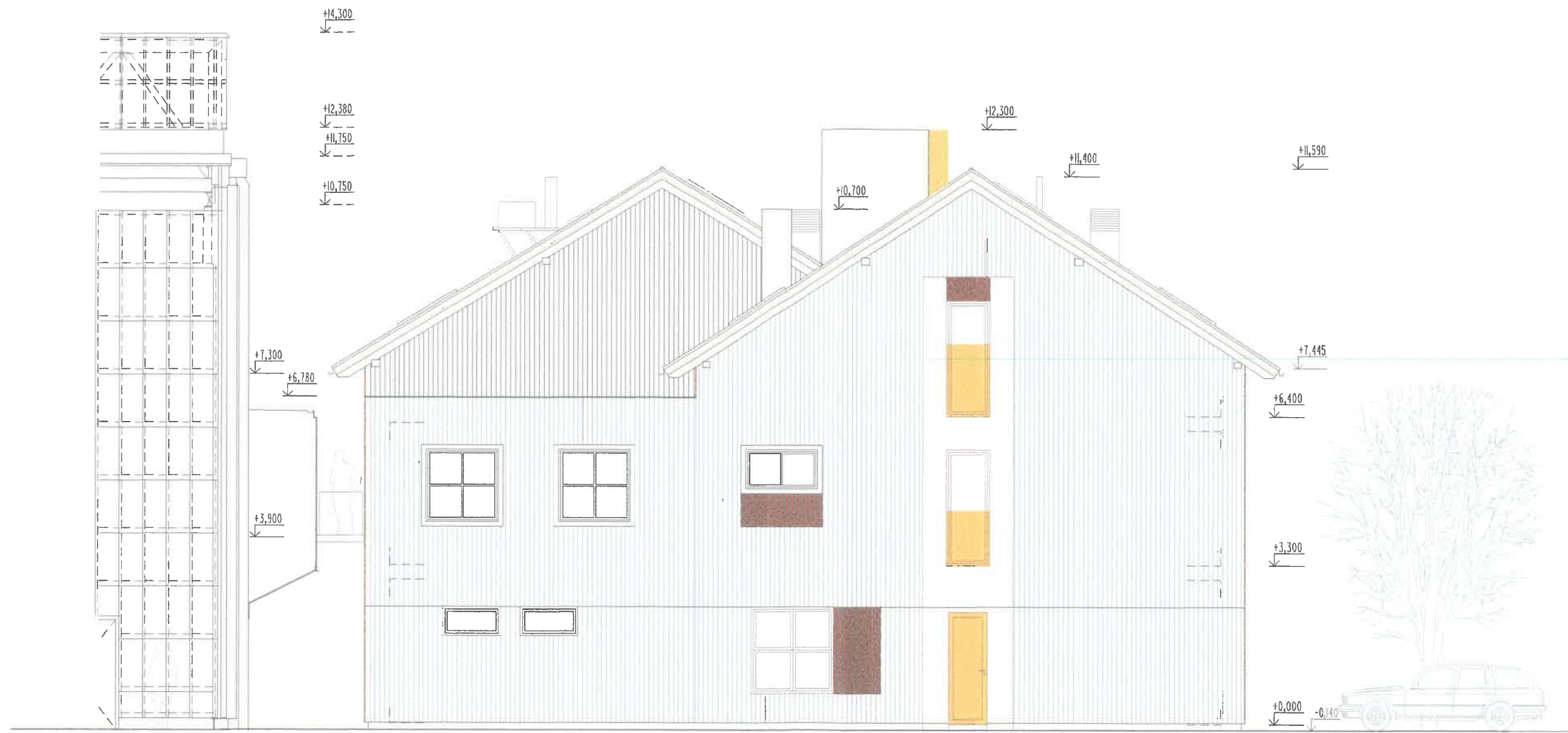
SEVERNÍ POHLED - NÁVRH